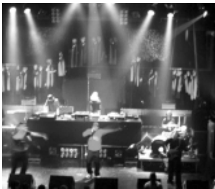
Helt kongelig Kronprinsen og andre hip hop-entusiaster fikk seg en overraskelse da Oslo Fluid stilte med eget gospelkor under Norwegian Hood for jul i fjor.

– Folk var helt i hundre, sikkert kronprisen også. Vi sang før Gatas Parlament uttalte seg negativt om monarkiet. For oss er det viktig å vise at et gospelkor kan fungere utenfor de rammene man vanligvis forbinder dem med. Hvis noen